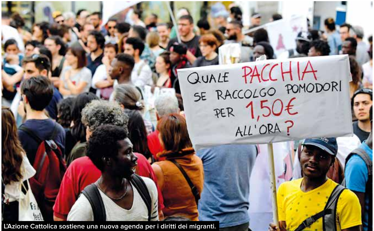
L'Azione Cattolica sostiene una nuova agenda per i diritti dei migranti.

come un garante della finanza internazionale contro il volere del popolo sovrano. Gli animi si sono poi rasserenati e una soluzione per varare il governo a guida Lega M5S è stata trovata.